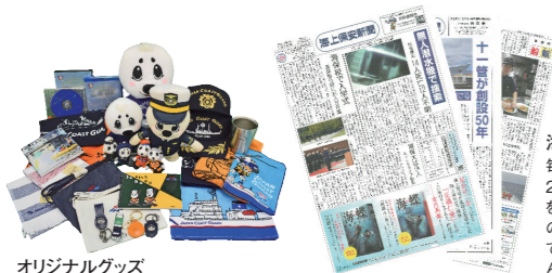
オリジナルグッズ

海上保安新聞 毎月3回程度発行、昭和24年の創刊以来3,500号を超えています。また、過去の貴重な紙面を電子化して保存する事業に取り組んでいます。