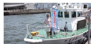
一日海上保安部長