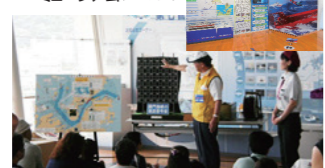
関門海峡での海上保安業務の説明