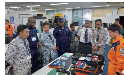
羽田特殊救難基地での研修