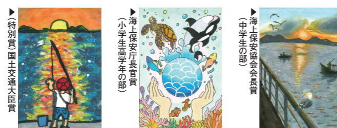
特別賞 国土交通大臣賞