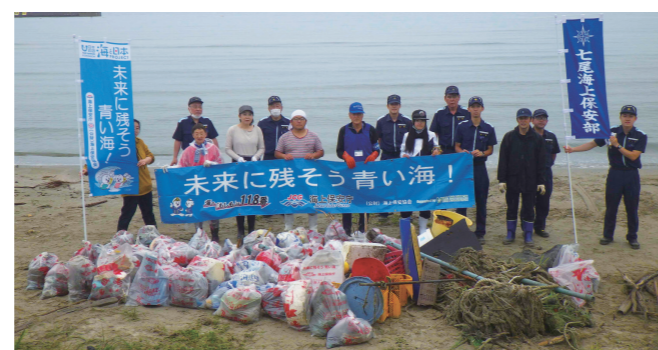
海上保安協力員による海浜等の清掃活動