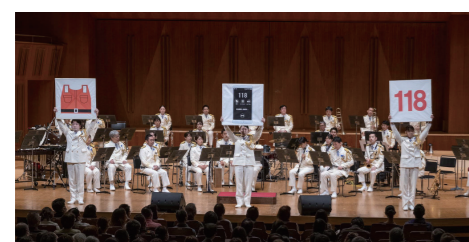
海上保安庁音楽隊定期演奏会