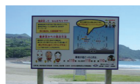
海浜事故防止啓発用立て看板